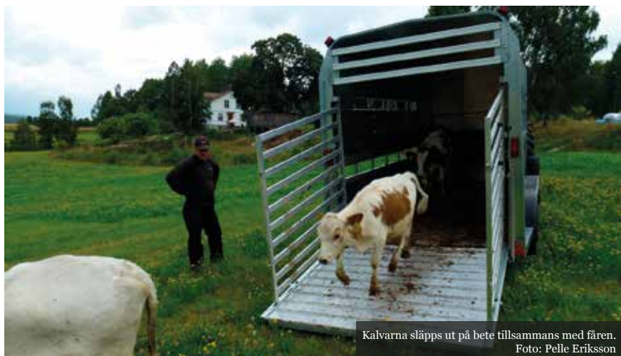
Kalvarna släpps ut på bete tillsammans med fåren.

Psst: i november planeras en matfestival på temat "närproducerat". Mer info kommer!