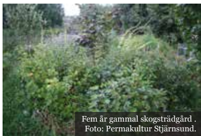
Fem år gammal skogsträdgård.

"Att leva i samklang med naturen istället för att försöka styra och bemästra den"