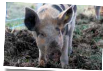
Folke, en av de tre Linderödsgrisar som glatt många järbobor i sommar.

Linderödsgrisen är Sveriges enda oförädlade lantras av svin.