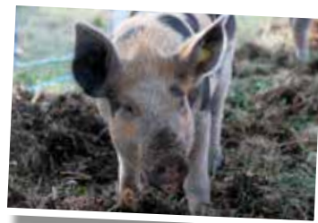
Folke, en av de tre Linderödsgrisar som glatt många järbobor i sommar.

Linderödsgrisen är Sveriges enda oförädlade lantras av svin.